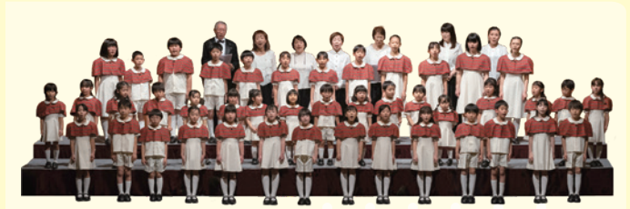
四條畷学園少年少女合唱団／エンジョイ・コーラス