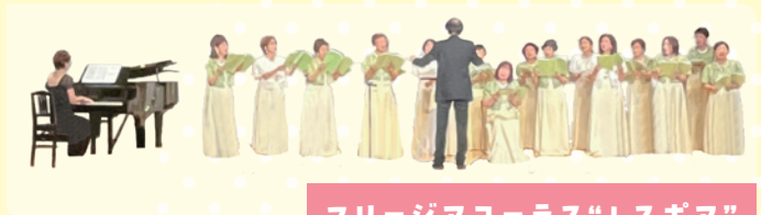
フリージアコーラス“レスポア”

「野に咲く花のように」など数々の名曲で知られる ダ・カーポが、いま子どもたちに伝えたい童謡を、 地域で活動する合唱団の皆さんとともにお届けします