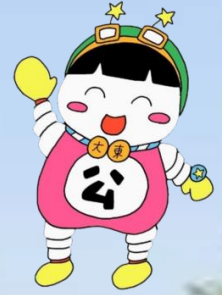
大東市立公民館キャラクター きらりん

秋の一日、緑と歴史に恵まれた野崎観音(慈眼寺)周辺を散策し、 「わがまち大東」の豊かな自然と文化の足跡に触れてみませんか？